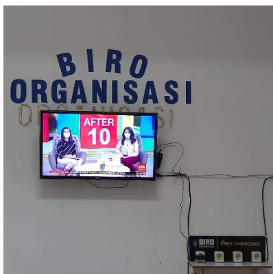
7. TV dan Charging Station