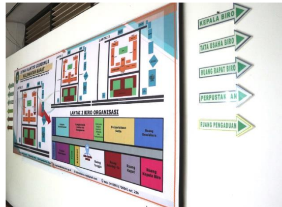
6. Denah Gedung dan Petunjuk Arah