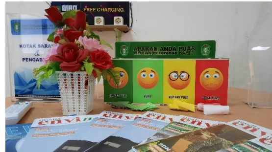
2. Desk Layanan