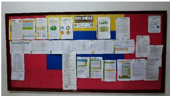
5. Papan Informasi