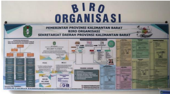
1. Banner Biro Organisasi