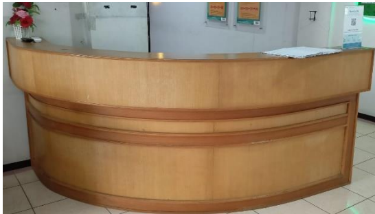
3. Desk Petugas Pelayanan