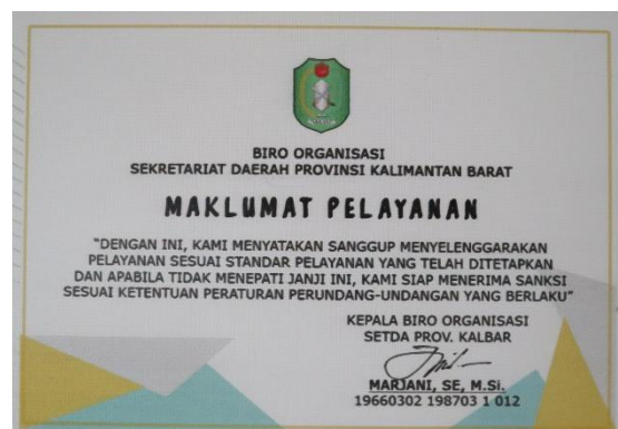
8. Maklumat Pelayanan