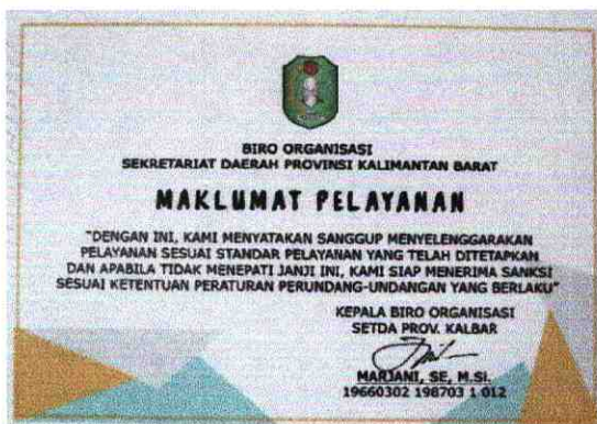
7. Maklumat Pelayanan