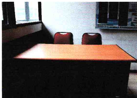
3. Desk Petugas Pelayanan