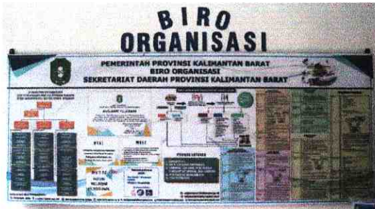
1 Banner Biro Organisasi