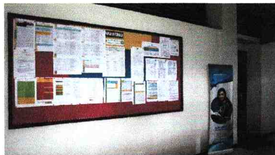
5. Papan Informasi