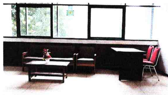
4. Ruang Tunggu Tamu